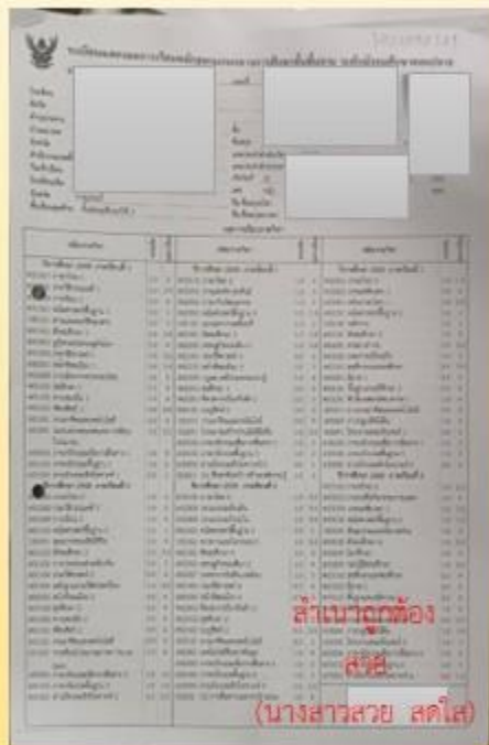
วุฒิการศึกษา