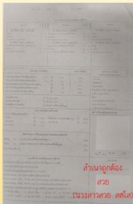
สำเนาทะเบียนบ้าน